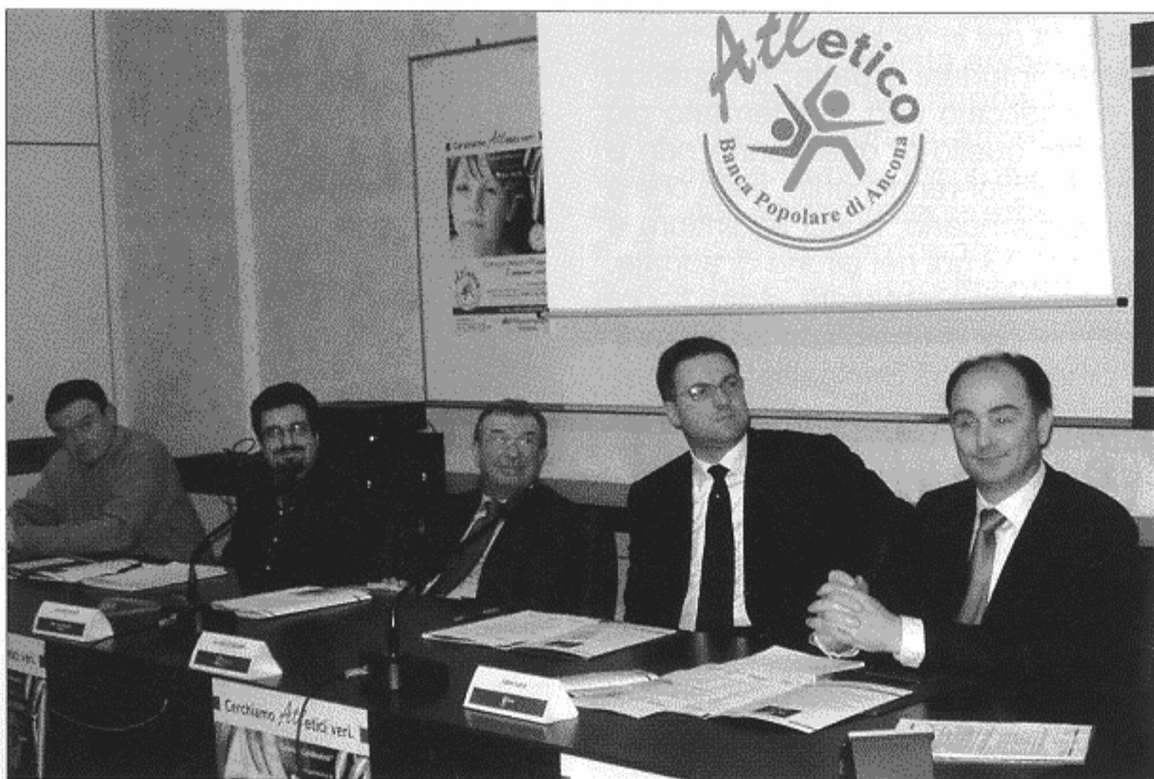
Il tavolo dei relatori alla conferenza di presentazione di Amico Atletico